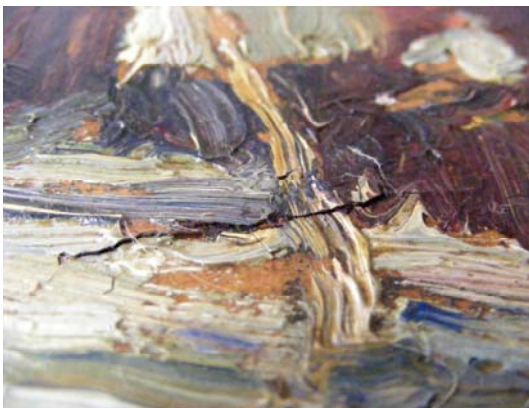
Foto 5 - desprinderi ale stratului pictural până la nivelul suportului