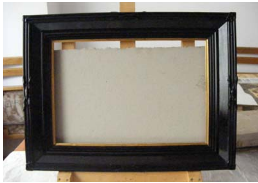
Foto 17- rama lucrării după restaurare