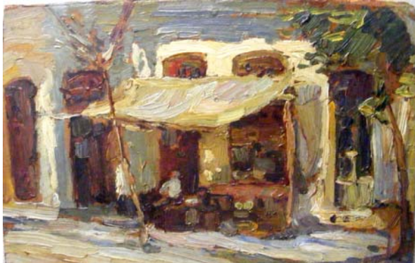
Foto 16 - ansamblu după vernisare și integrare cromatică