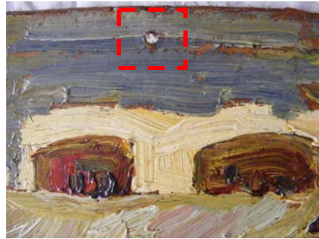
Foto 11,12 – lacune de mici dimensiuni chituite cu chit nou de restaurare