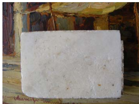
Foto 8, 9,10 - etape ale consolidării stratului pictural