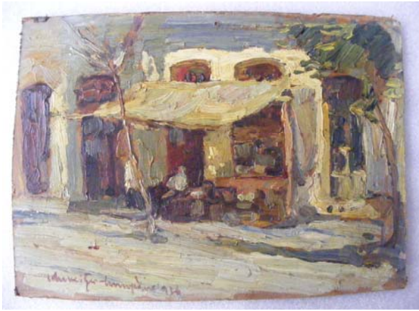
Foto 7 - depuneri de murdărie aderentă pe toată suprafața picturii

Restaurarea lucrării a constat într-o succesiune de operațiuni: