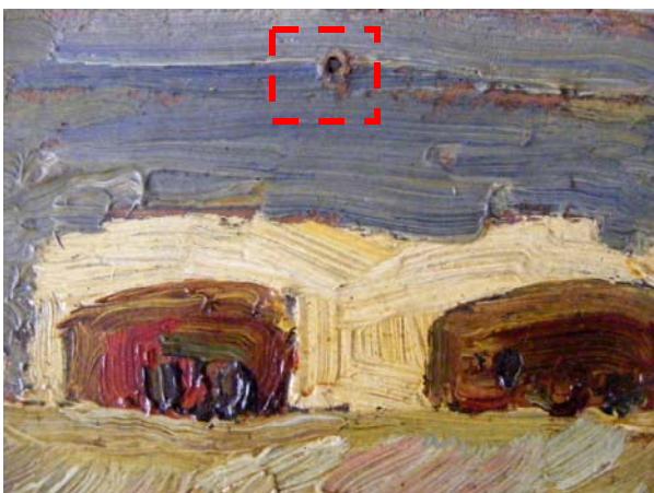
Foto 3 - zonă lipsă din suport de mici dimensiuni (panotare incorectă)