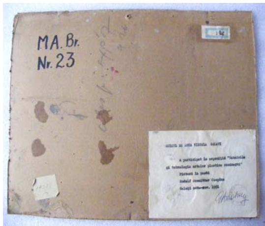
Foto 2 - ansamblu verso