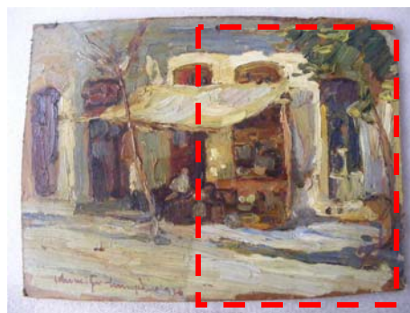
Foto 13, 14, 15 – etape ale curățării verniului îmbătrânit și a murdăriei aderente