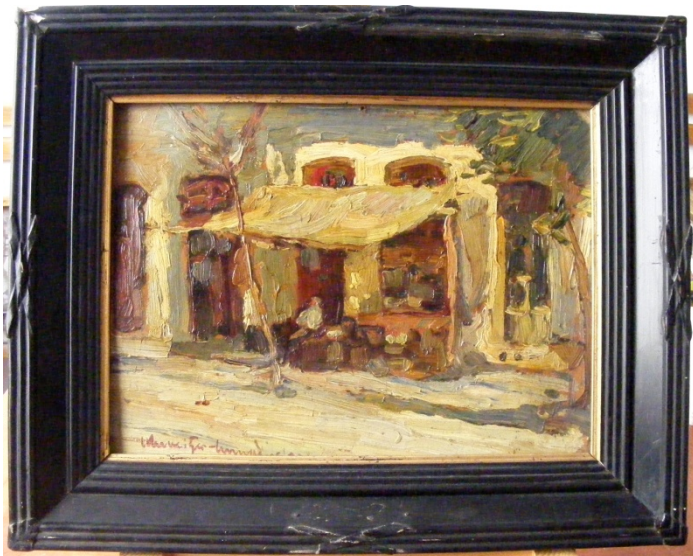
Foto 1- ansamblu lucrare

Lucrarea Peisaj brăilean este în tehnica ulei pe carton. Ceea ce se remarcă în acest peisaj este construcția formelor în relief, pasta fiind modelată, uneori aplicată excesiv de abundent. Stratul de preparație constă în aplicarea înainte de pictarea propriu zisă a unui strat simplu de clei fără adaos de materii albe. Paleta este caldă, în tonalități grave și profunde.